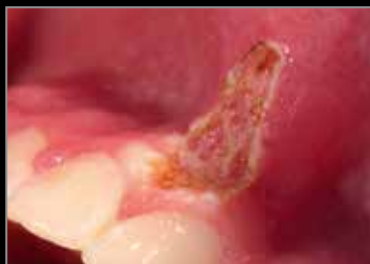
Inmediatamente después de la intervención