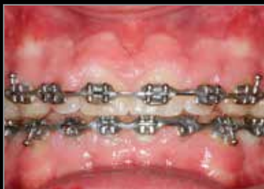
Antes de la intervención

Los casos clínicos cedidos por el Dr. Bob Miller - Park City, UT (USA)