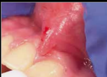
Antes de la intervención