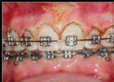
Inmediatamente después de la intervención