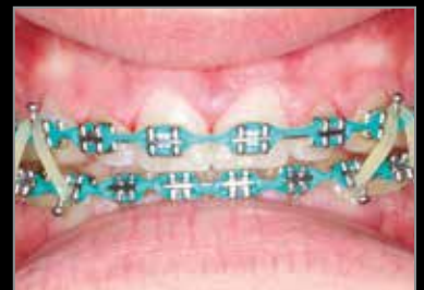
30 días después de la cirugía