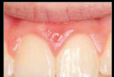
30 días después de la intervención